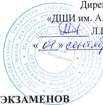
ГРАФИК ВЫПУСКНЫХ И ПЕРЕВОДНЫХ ЭКЗАМЕНОВ

учебных образовательных программ учащихся музыкального отделения на 2023-2024 учебный год.