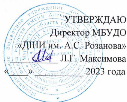
ГРАФИК ВЫПУСКНЫХ И ПЕРЕВОДНЫХ ЭКЗАМЕНОВ учебных образовательных программ учащихся хореографического отделения на 2023-2024 учебный год.